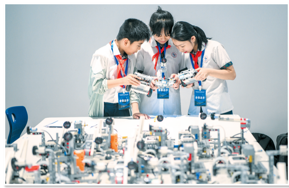
4月6日,在无人机综合应用接力挑战赛现场,小选手正在对机器人做最后的检查。

本报4月7日讯(记者王子豪)4月6日,第五届海口市青少年机器人竞赛在位于琼山区三门坡镇的海南英雅德学校举行,来自全市135所学校共1466名学生现场上演“机器人总动员”,在9项赛事中运用科技与创意“碰撞”出智慧火花。 通过编程、AI图像识别等技术操控无人机组件障碍物并“打击”目标,使用独立设计制作的机器人开展紧急救援并完成运送紧急救援物资……比赛现场,参赛队员